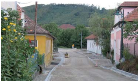
Während der Bauarbeiten