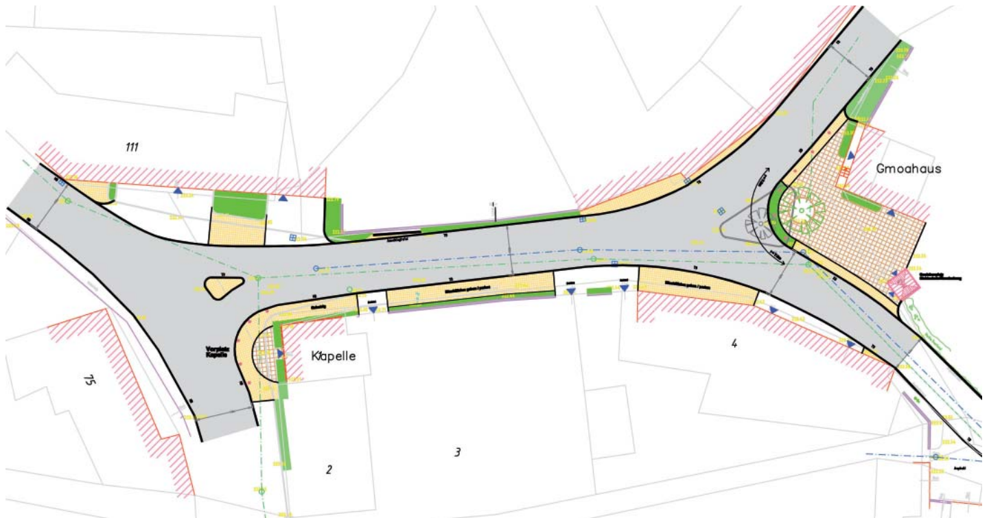
Straßenraumgestaltung „Kapelle - Gmoahaus“

AUFTRAGGEBER: Wassergenossenschaft Etzersdorf