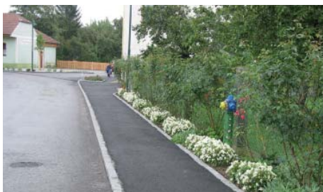
Typisches Ortsbild nach den Bauarbeiten