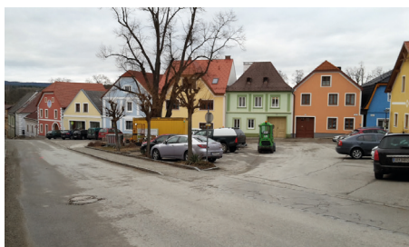
Dr.-Kordik-Platz vor Neugestaltung